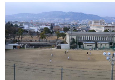
旧加茂小学校、左プール 右が体育館

→②ところが川西市は、待機児童の解消と銘打って市立幼稚園と保育所の統廃合を提案してきました。国のすすめる合理化方針と全く同じ方向性です。