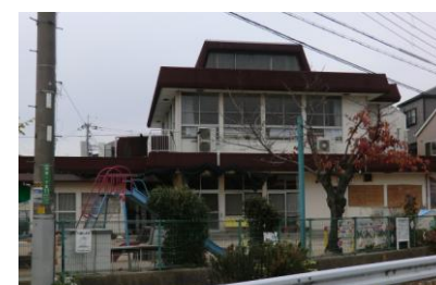
上・加茂保育所、下・幼稚園

中央では、川西北幼稚園、中央保育所、小戸保育所、北保育所の4つを一つにまとめるということです。定員数では200名を超える施設を作り、さらに待機児童、ゼロ歳児など受け入れようとしたらマンモス施設になります。保護者の願う施設になるとは思えません。→③