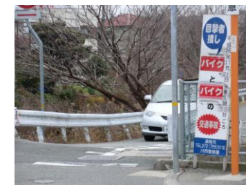
一般質問直前にも事故