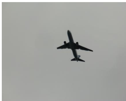
久代上空を飛ぶジェット機

これまでも川西南部住民は騒音に悩まされ続けてきました。低騒音ジェット機で「うるささ」が低減できるのか、金属音が低減できるのか、安全面はどうかなど課題があります。