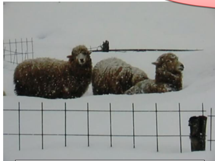
雪の中の羊たち。

新年あけましておめでとうございます。昨年十月は市議会選挙、続いて十二月は衆議院選挙と連続し、皆様には何かとご協力いただき感謝しています。ありがとうございます。