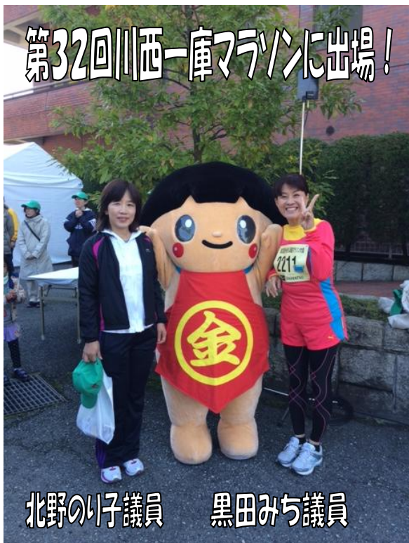
第32回川西一庫マラソンに出場!